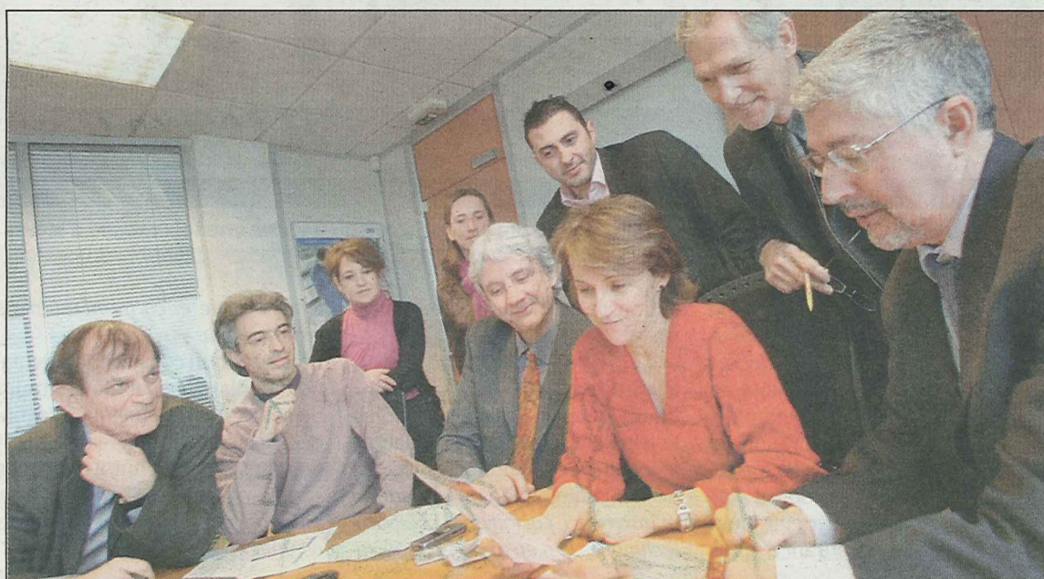
Après la formation d'ascensoriste, les organisateurs entendent récidiver et lancer une nouvelle formation, toujours réservée aux femmes, permettant de devenir storiste !

L'objectif : donner à des femmes, éloignées de l'emploi et en situation difficile, l'occasion de décrocher à la fois une formation profes-